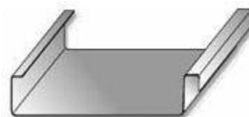
Profil „Doppelstehfalz” Profil cu falț dublu, vertical