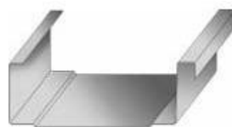
Profil CLIP RELIEF Se oferă la cerere !